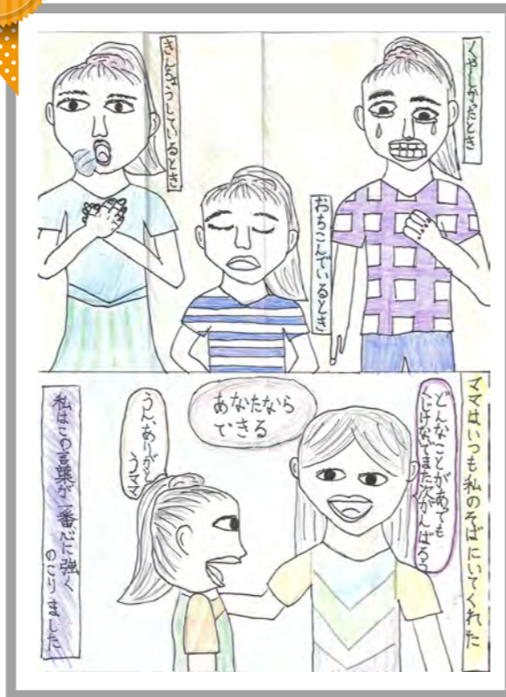
ママが寄りそってくれた思い出