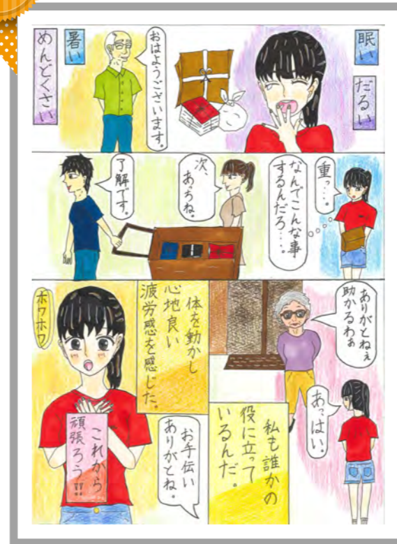
私にもできること カビゴンさん