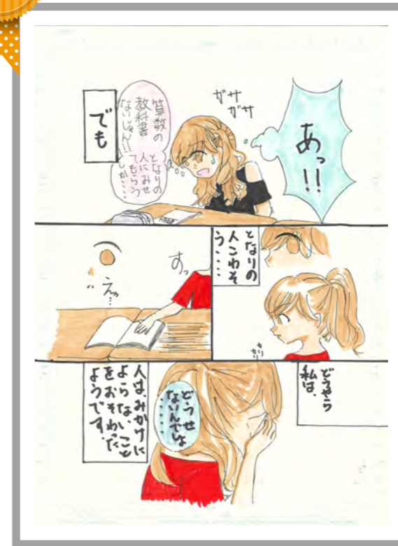
人はみかけによらない ほっしーさん