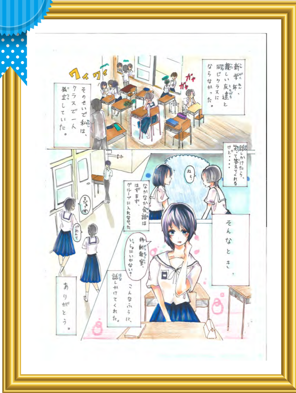
いっしょに行こう! キノさん